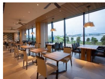
アヴァンシア店内イメージ

※表示の料金にはいずれも消費税・サービス料が含まれます。 ※画像は全てイメージです。