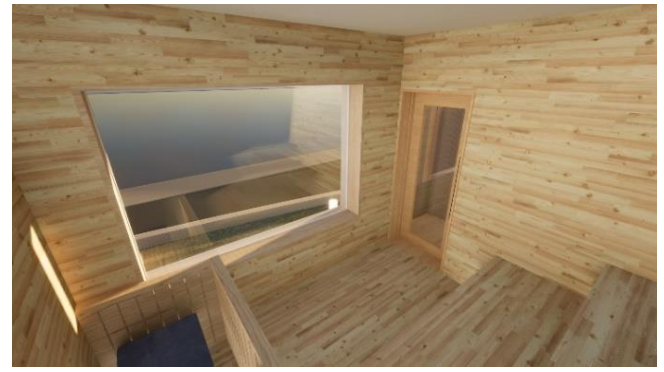
サウナ室からは宍道湖が一望でき、至福の時間を過ごせます