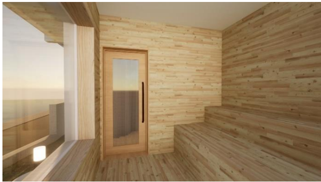
木の香りが清々しいサウナ室

※ ロウリュ…フィンランドのサウナ入浴方法で、ストーブ上で温められたサウナストーンに水をかけて蒸気を発生させること。