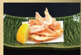
富山産白海老かき揚げ